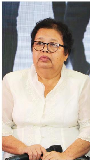
▲ บึงอร วันน้อย

บมจ.ซีพี ออลล์ เป็นหนึ่งองค์กรที่ให้การสนับสนุนเอสเอ็มอี โดยเปิดโอกาสให้เข้ามาร่วมธุรกิจผ่านช่องทางจำหน่ายที่มีประสิทธิภาพของบริษัท ล่าสุดซีพี ออลล์ ได้ดำเนินการจัดงาน “วันแห่งโอกาส@CP ALL ที่อาคารรัฐประศาสนสมภักดี (อาคารบี) ศูนย์ราชการ ถนนแจ้งวัฒนะ ซึ่ง